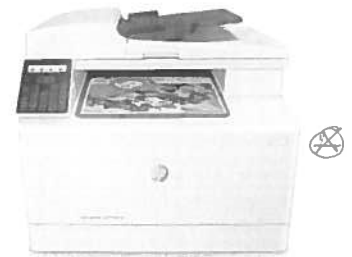
Stampante multifunzione HP Color LaserJet Pro M181fw