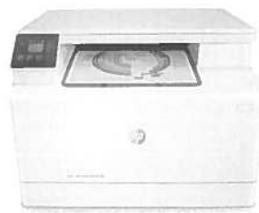
Stampante multifunzione HP Color LaserJet Pro M180n

Colori brillanti, versatilità wireless, stampa da dispositivi mobile semplificata ed elevate velocità, puntando direttamente all'efficienza per ottenere grande convenienza.